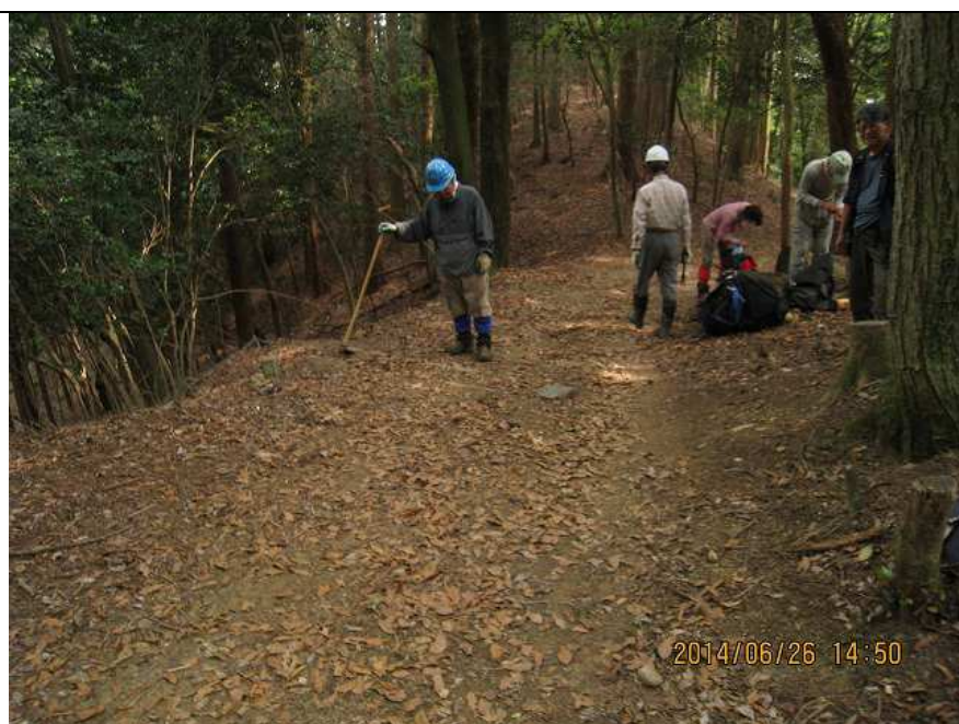
作業-2 登山道水切り溝整備 作業前 遠景