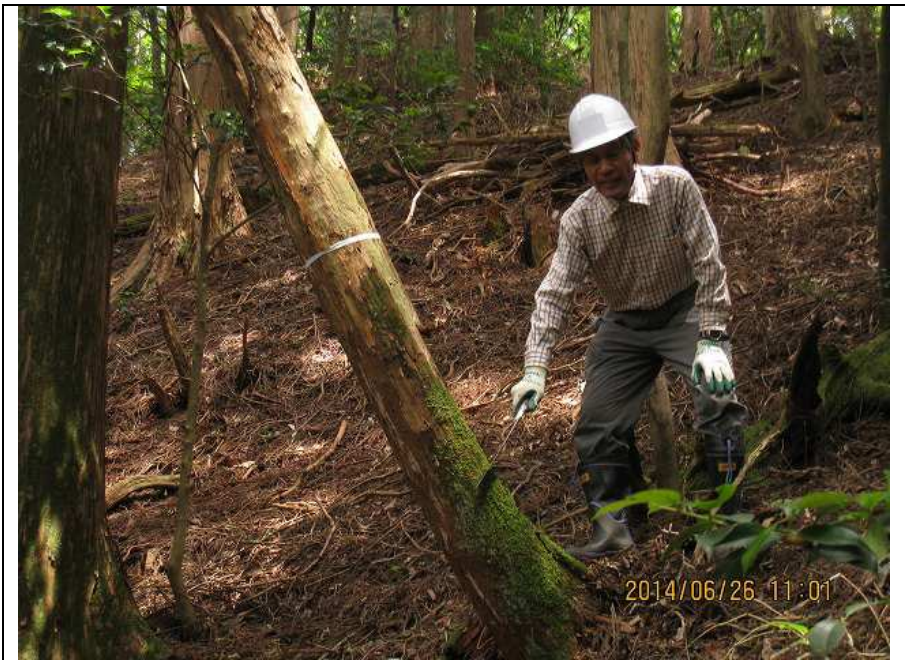
作業-1 作業前 近景