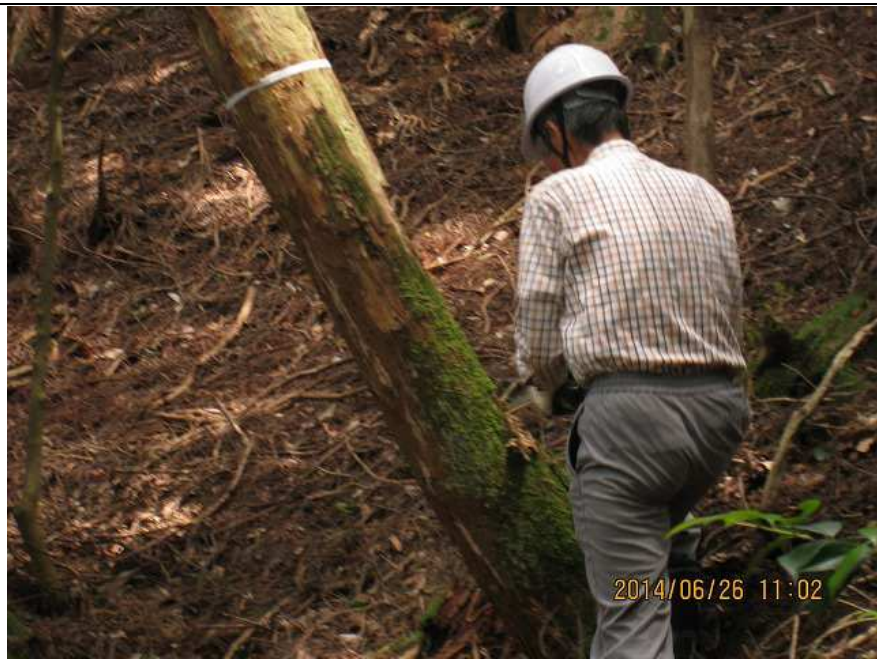
作業-1 作業中 近景