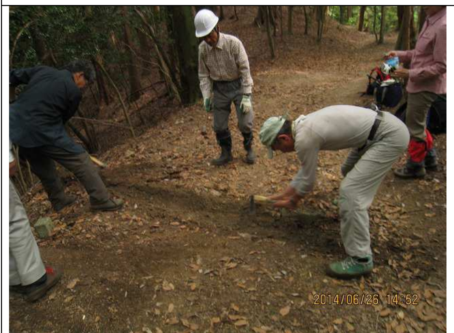
作業・2 作業中 近景