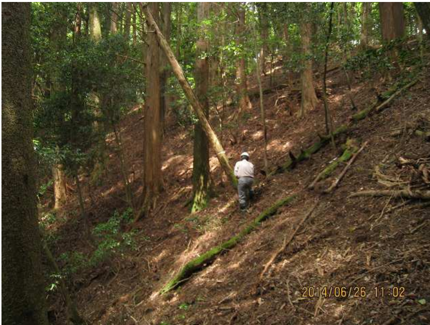
作業-1 作業中 遠景