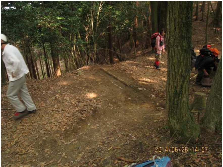
作業・2 作業後 遠景