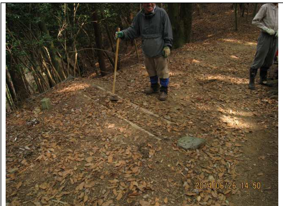
作業・2 作業前 近景