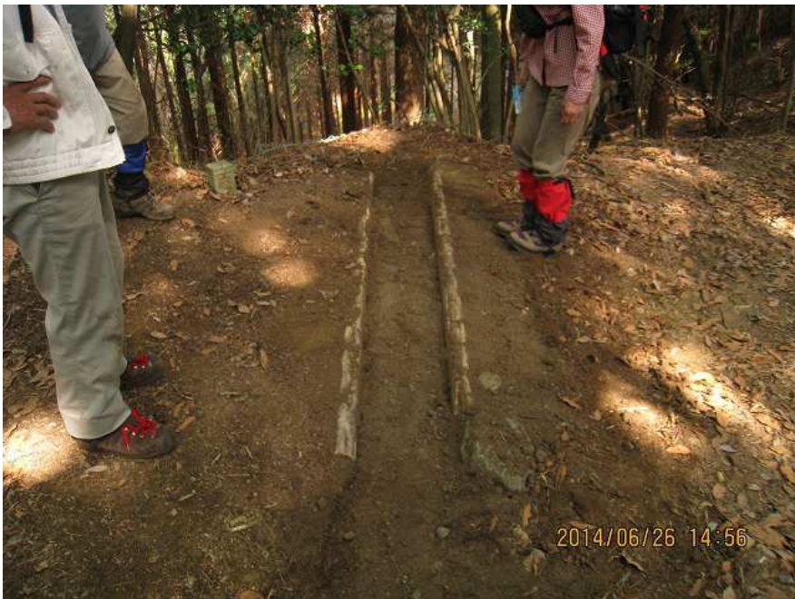
作業-2 作業後 近景