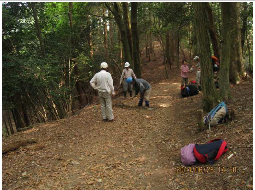
作業・2 作業中 遠景