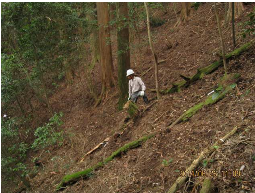
作業-1 作業後 遠景