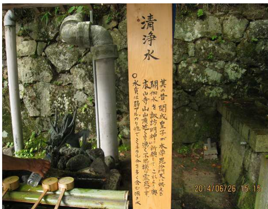
水源地の説明板（本山寺境内）