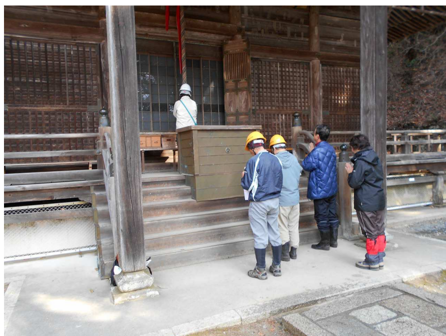
② 安全祈願のお参り 本山寺本堂