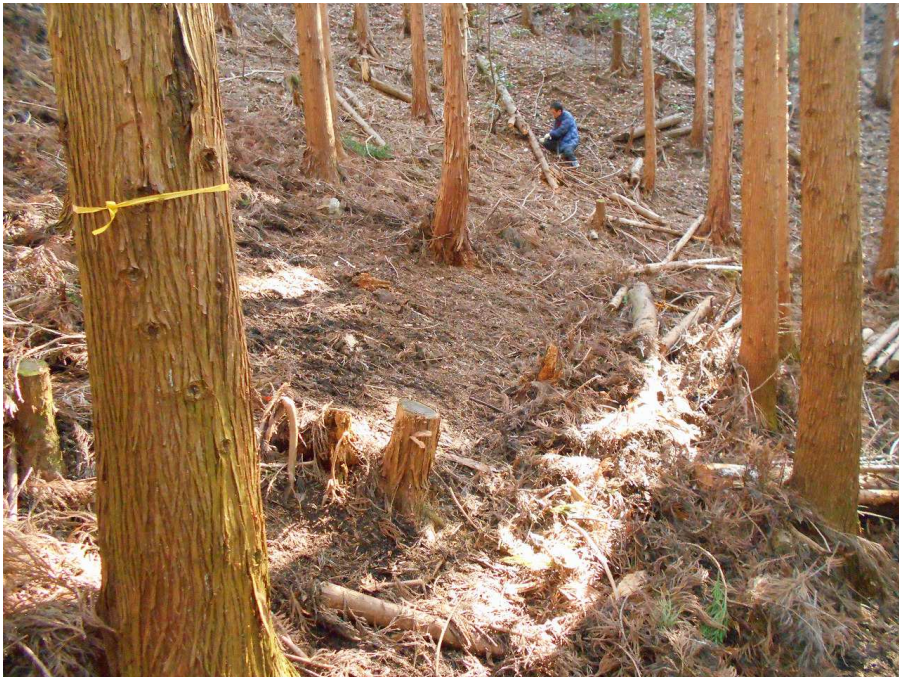
⑥ 林床整備 作業後