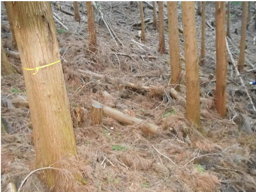
④ 林床整備 作業前