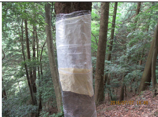
⑥ ナラ枯れ防除対策済