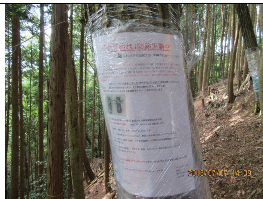
⑦ ナラ枯れ防除対策 啓蒙ポスタ