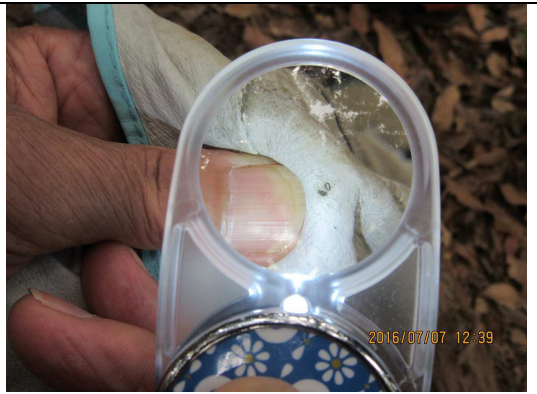
⑭ 皮手袋についたダニ