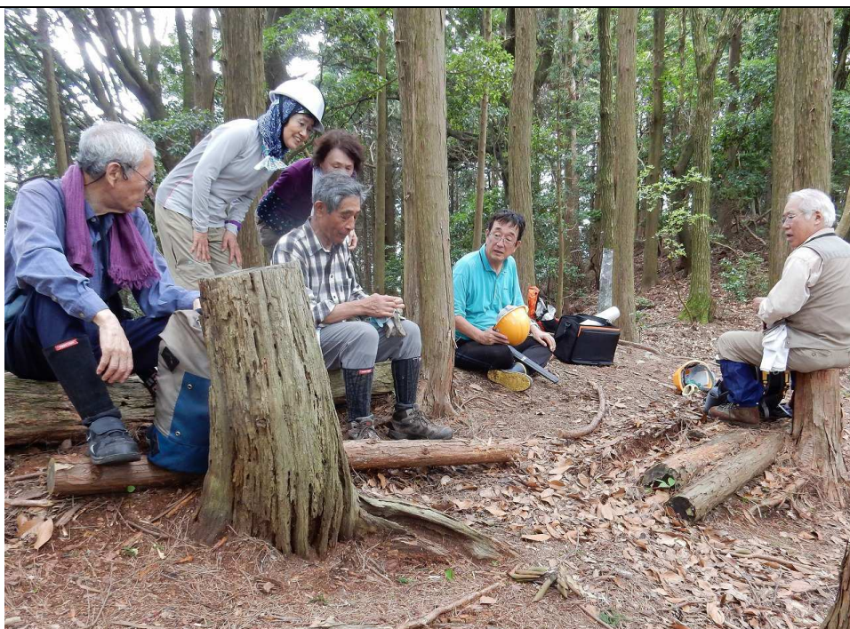
⑮ 昼食後の団欒風景