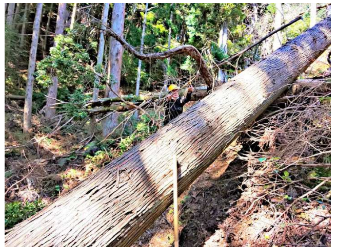
【邪魔な枯れ枝を落とす】