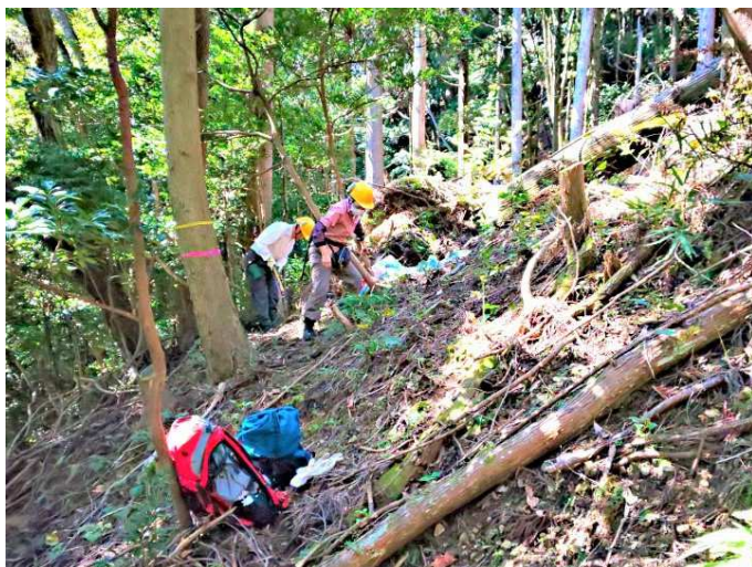
【切り落とした枯れ枝を整理】