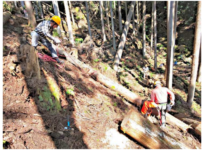
【玉切りしては移動させる】