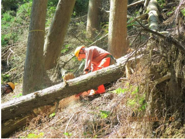
【経路を遮る倒木の除伐】