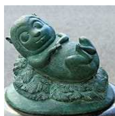
← 水木しげるロードのブロンズ像

(何度目かの)コロナ明け。活動地には二ヶ月間の「ご無沙汰」。すっかり鈍ったこの身体、どう立て直す??? ↓厄除招福のご利益は「件(くだん)」様から