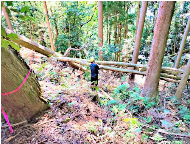
【上方での倒木処理】