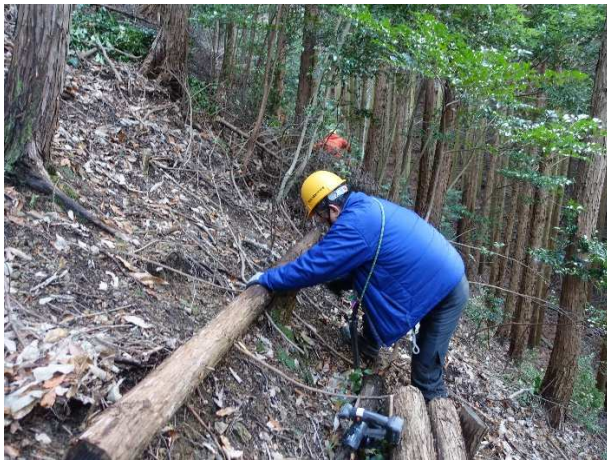
【斜面に「杭打ち棚積み」中】