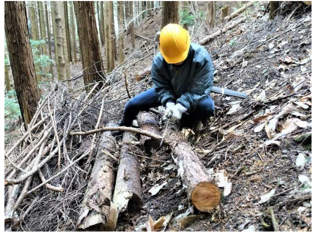
【邪魔な枝切りも結構手間取る】