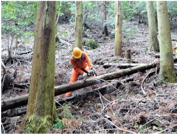
【倒し放しの間伐木を先ず玉切り】