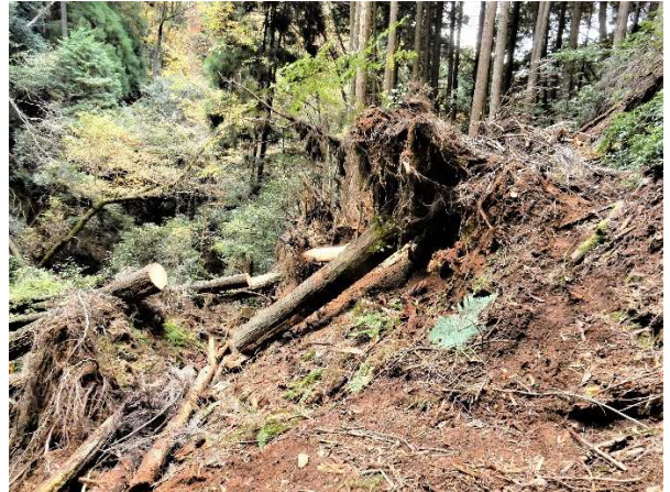
【道を塞ぐ根起こし(水源側から昨年 11 月撮影)】