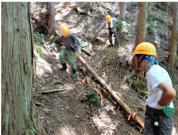
【漸く倒木を路肩にセット】