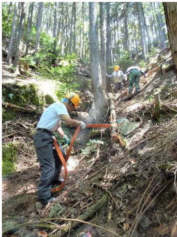
【道の上まで降ろした倒木】