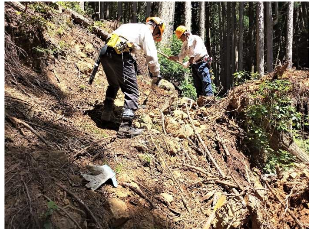
【高巻道造成中(下流側から)】