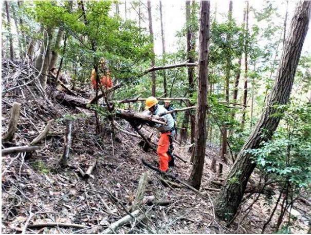
【邪魔な倒木を始末】