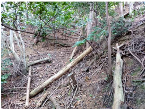
【作業場所はこんな山腹】