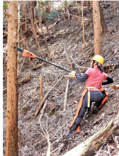
【高枝切りチェーンソーの試用】