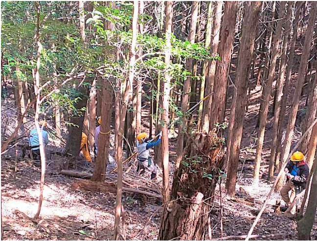
【高枝切り鋸の競演(弁慶の薙刀タイプ)】