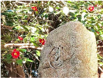
【冬の終りは寒椿(44林班への分岐)】