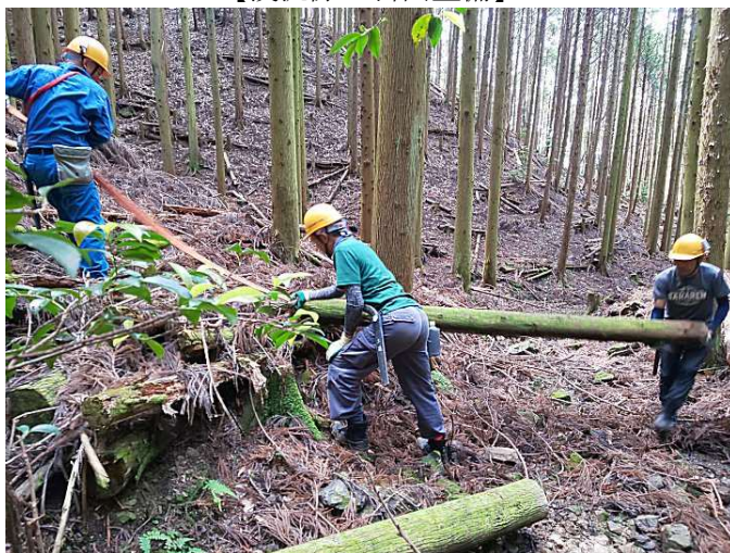
【溪流際の斜面整備】