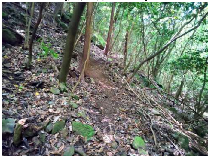
【延伸作業歩道の開通】