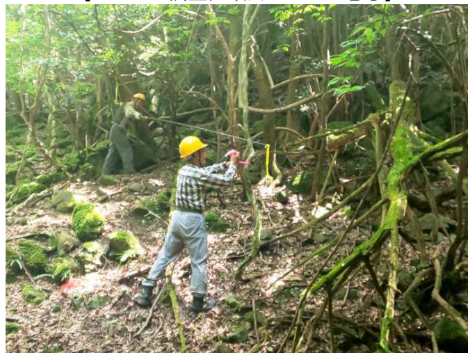
【100 m 2 の調査区域内のテープ巻き】