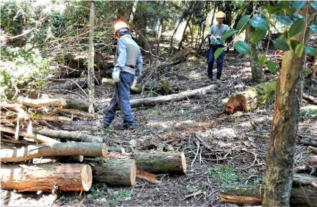
【スッキリしてきた山腹】