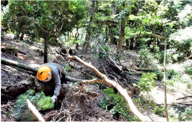
【山頂部山腹の林床整備】