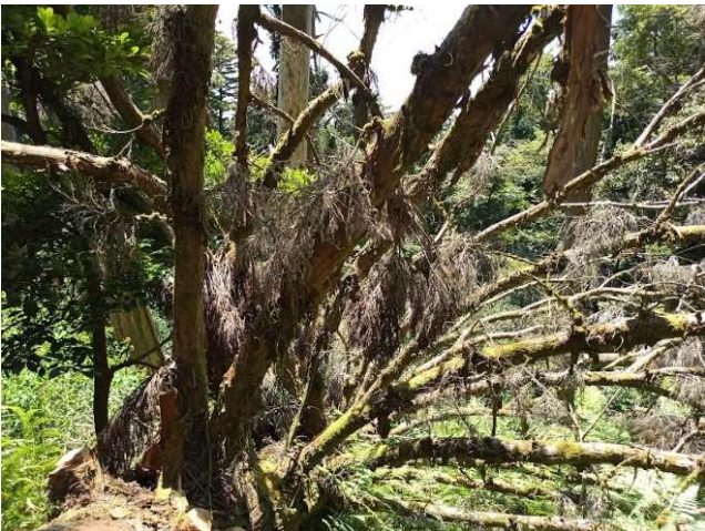
【今も残る 21 号台風の爪痕】