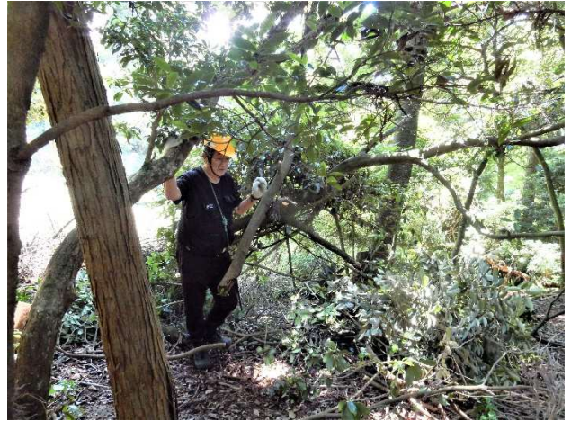
【絡み合う枯損木の処理は難渋の一言】