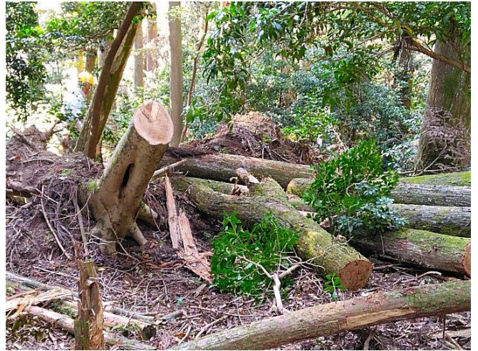
【左のこの先は大作業につき、又の機会に】