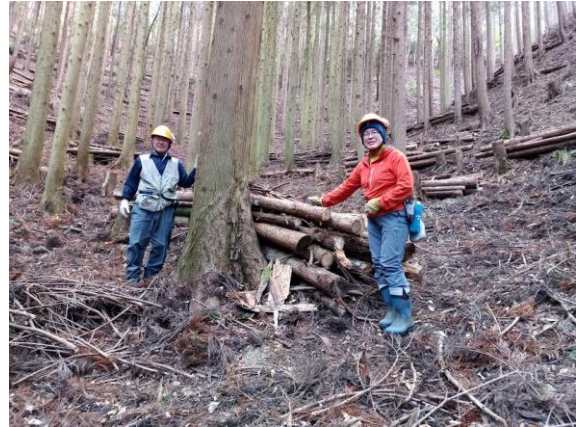
【山腹部 きれいな積み上がり】