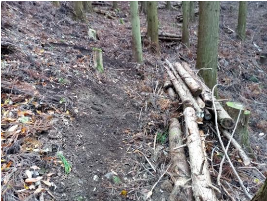
【山腹部 作業道路肩に棚積み】