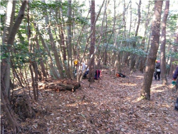
【尾根頂部で作業中】