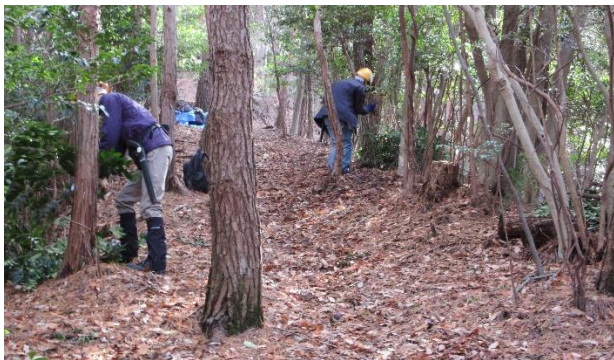
【尾根頂部での作業風景】