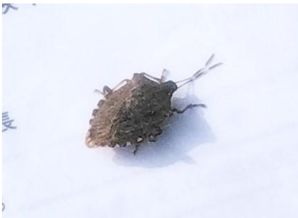
【小屋の家主 カメムシ君】