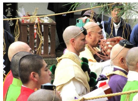
【櫻本坊からは次期ご住職も】

初寅会は聖徳太子が寅歳・寅の日・寅の刻に毘沙門天に感応した縁日を祀るもの福徳・金運あり？