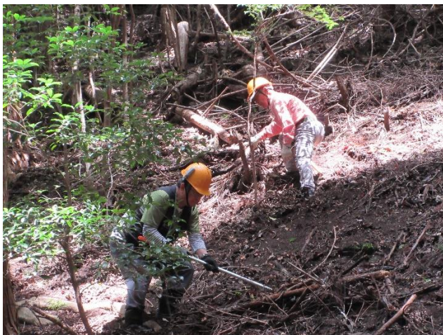
<拡幅・林床整備中>