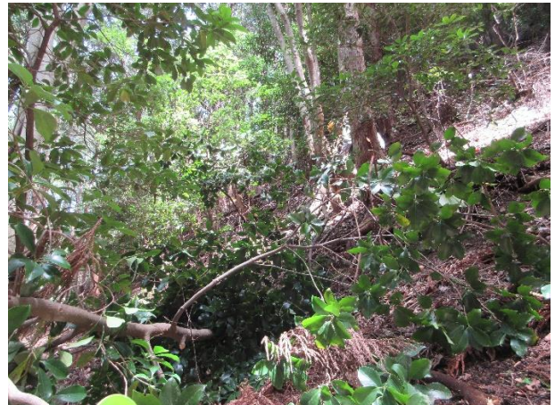
<邪魔な広葉樹を伐ってルートを延伸する>