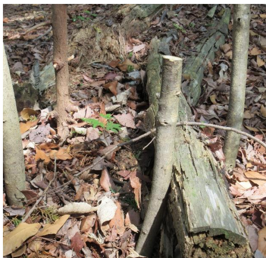
<③モミジ 鹿避け囲いの効果は如何？>