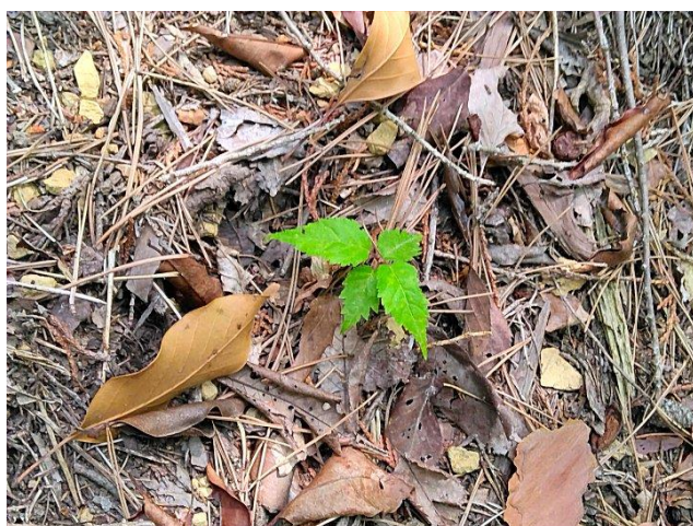
<以下三葉：春の目覚め①ヤマザクラ>