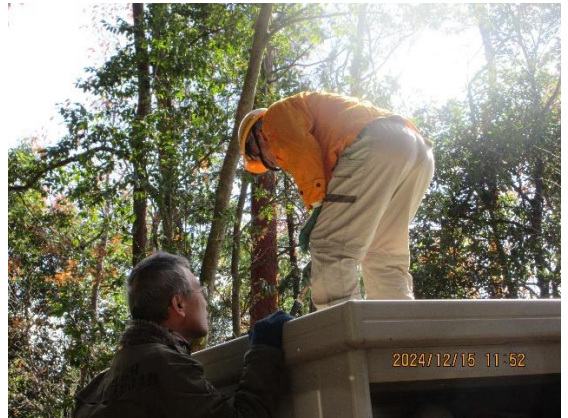
<屋根に積もった落葉を掃く>