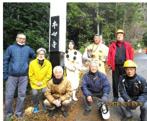
<本山寺駐車場 洗心門前にて>