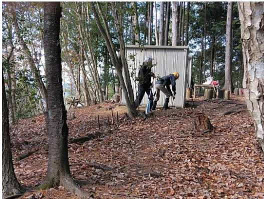
<小屋回りの落ち葉掻き>