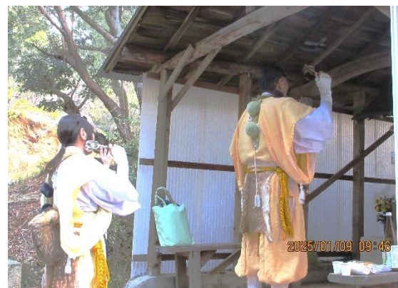
<祈願 始まる(右下にお供物)>