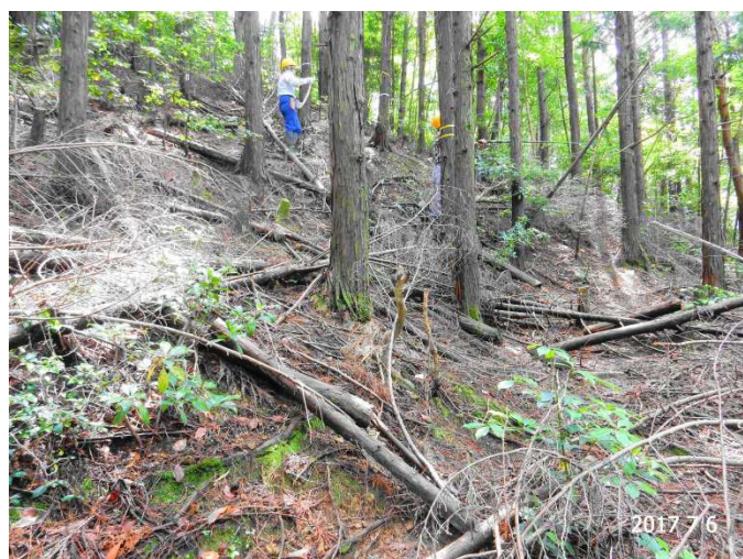
人工林での円形調査区設定中