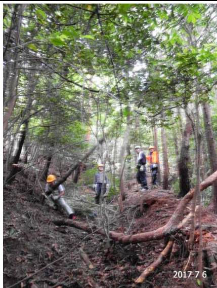
小涸沢を整備する