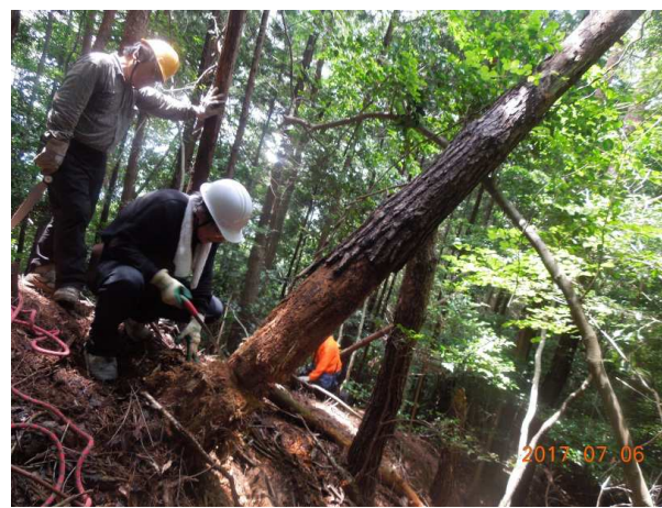
格闘 中々倒れてくれない松の枯木