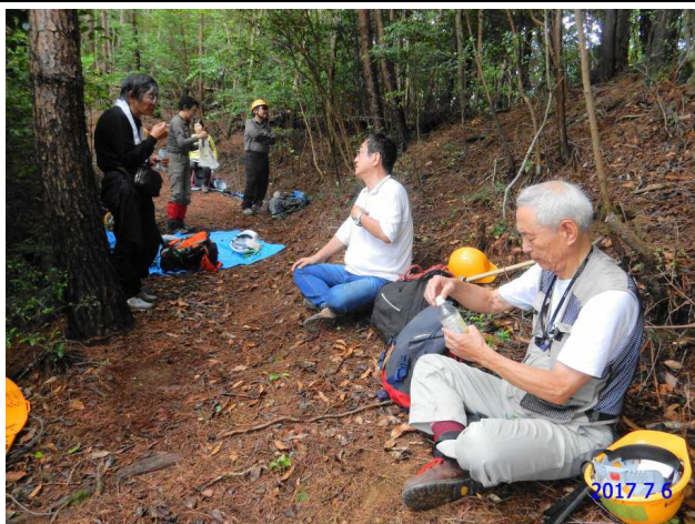
昼時の一休み—これが何より