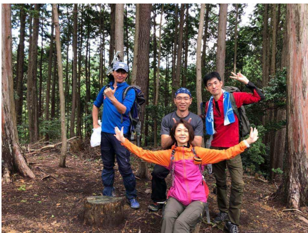
<集合写真—終了時(一名は途中で下山)>