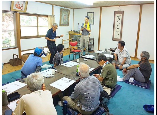
【講義中(ロープの使い方)】