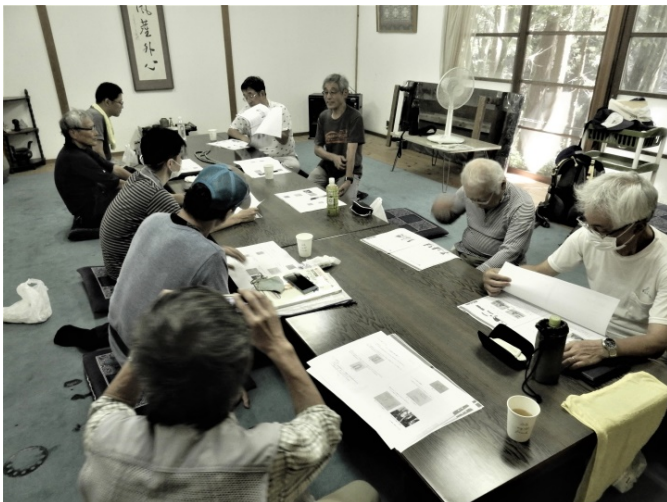
【講義中(伐倒時の注意事項)】