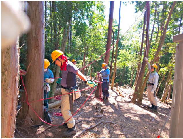
【枯損木除伐(ロープ展張中)】