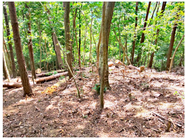
【左の除伐後 足元スッキリ、倒木も棚積み】