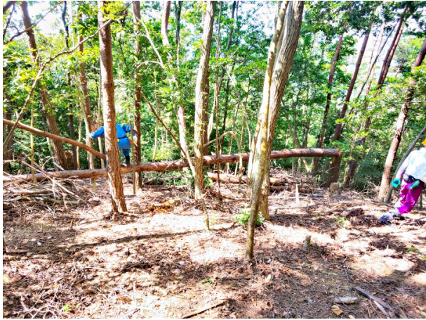
【作業小屋 西側の倒木】