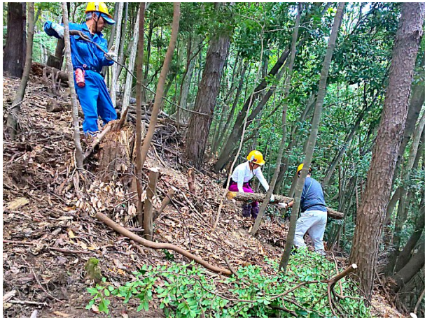
【斜面の林床整備①ー力仕事・根仕事】