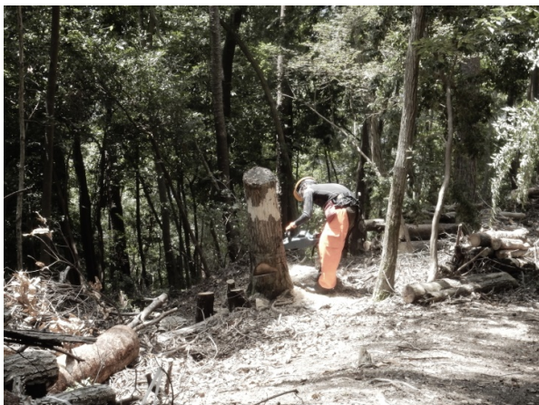
【除伐後は根本もキレイに】