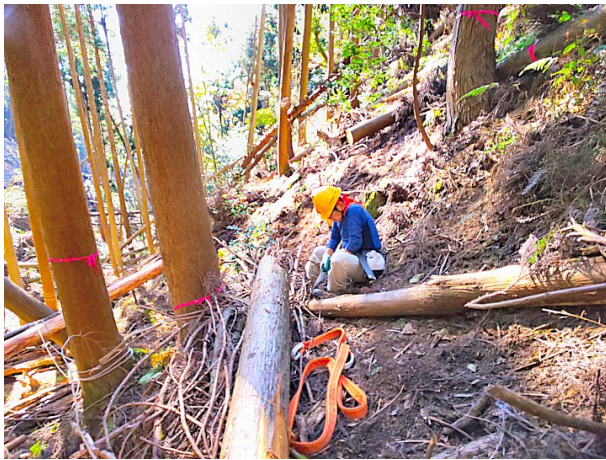
【足元と斜めにノビた倒木で土留めを作る】