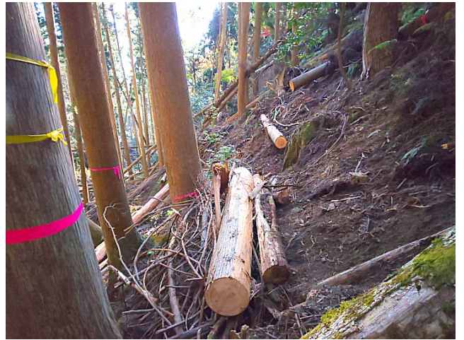
【完成した中心木付近の土留め】