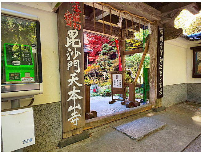
【庫裏の庭の紅葉-チラリの美】