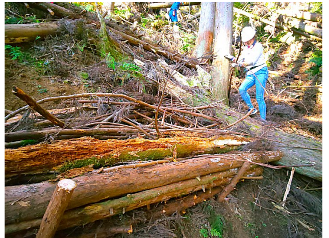
【杭打ちで土留めを作る-緩い土壤が難物】