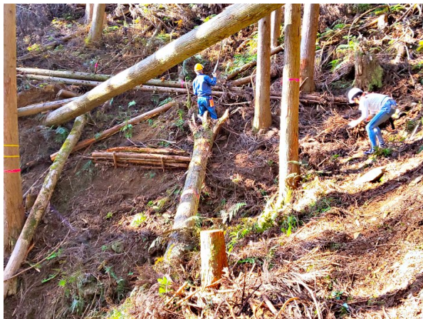
【横に寝た倒木を玉切りして土留め材に】